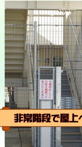
非常階段で屋上へ