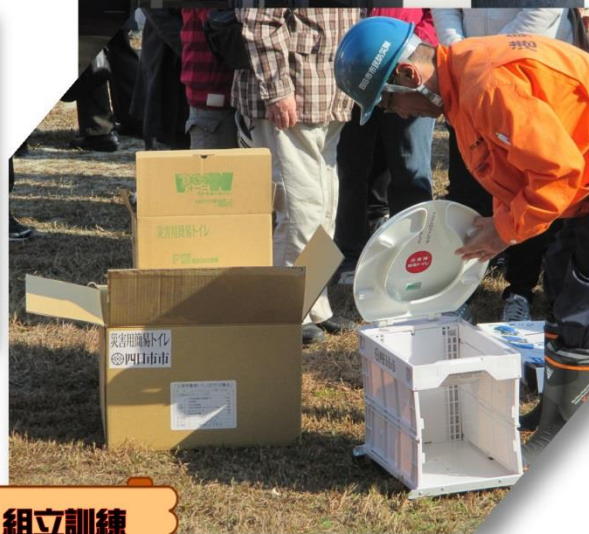
仮設トイレ組立訓練